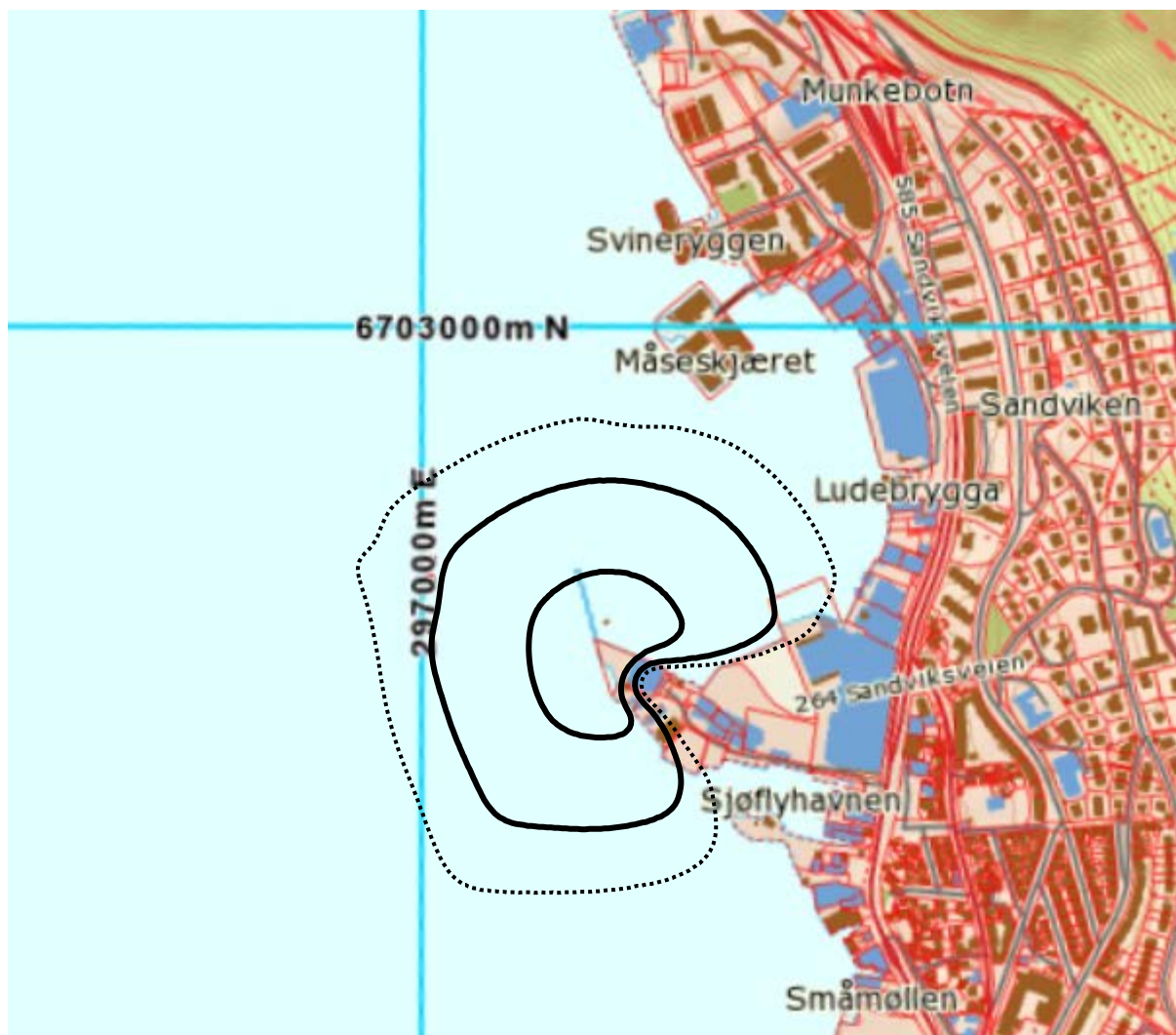
Figur 3-2 Kartleggingsgrenser relatert til forurensningsforskriften. Kurvene viser L_{eq24h} på 55 (stiplet), 58 og 65 dBA. M 1:15 000.

Eksisterende virksomheter skal vurderes opp mot forurensningsforskriften 2 . Forskriften foreskriver at dersom en støykilde medfører at innendørs støynivå i en bygning med støyfølsomt bruksformål overskrider 42 dBA målt med enheten L_{eq24h} så må kildeeier gjøre tiltak på bygningen for å få ned innendørsnivået. Kartlegging av slike bygninger skal foretas dersom beregnet innendørs nivå overstiger 35 dBA. For helikopterlandingsplasser tilsvarer dette kartlegging av slike bygninger dersom utendørs støynivå overskrider et nivå målt i L_{eq24h} på 58 dBA. Dersom det er andre like sterke kilder i området skal disse summeres og kartleggingsgrensen flyttes ned til utendørs nivå målt i L_{eq24h} på 55 dBA. I det følgende kartet er disse grensene tegnet sammen med den som tilsvarer en tentativ tiltaksgrense (65 dBA).