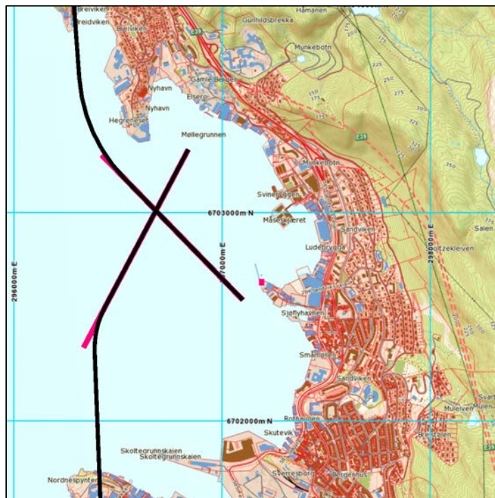
Figur 2-2 Inn og utflygingstraséer for sjøfly. M 1:25 000.