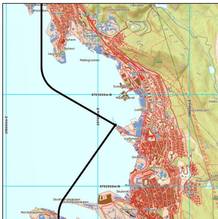
Figur 2-1 Inn- og utflygingstraséer for helikopter. M 1:25 000.

Typiske hastigheter for helikopter er angitt til 60 knop ved landinger og avganger; klatre- og gjennomsynkingsrate er angitt til 500 fot pr minutt. I beregningen simuleres innflyging med en 6 graders glidebane. For sjøfly er det lagt inn 3 graders glidebane ved innflyging. For avganger er det beregnet 50 % økning i avstand på sjøen i forhold til ground roll for flytypen. Starthastighet er satt til 5 knop.